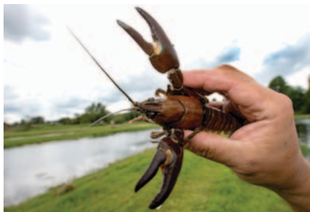
Signalkräftan känns igen på den lilla vita fläcken i tumgreppet på klon.

3 augusti 2016 trädde nya EU-förordningar för hanteringen av signalkräft-